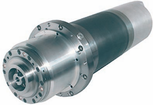
Motorspindeln für Fräsoperationen