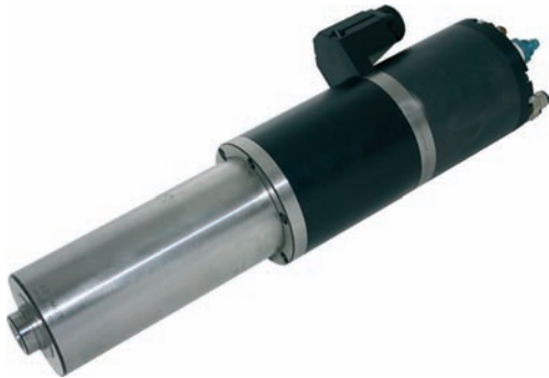
Motorspindeln für Leichte Fräsoperationen