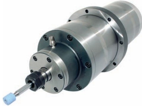
Motorspindeln für Schleifoperationen